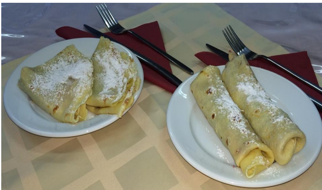
"Ide süss! " Palacsinta party a Szabókyban! Próbáld ki, forgasd meg, dobáld fel, süsd meg! Sósat és édeset, túrósat vagy ízeset, gundelt, hortobágyit, ki amire vágyik!