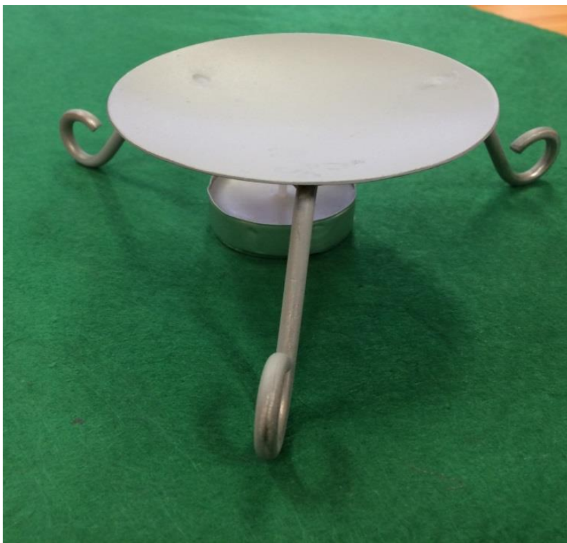
Horganyzott fémlemezéből készített háztartási illóolaj párologtató