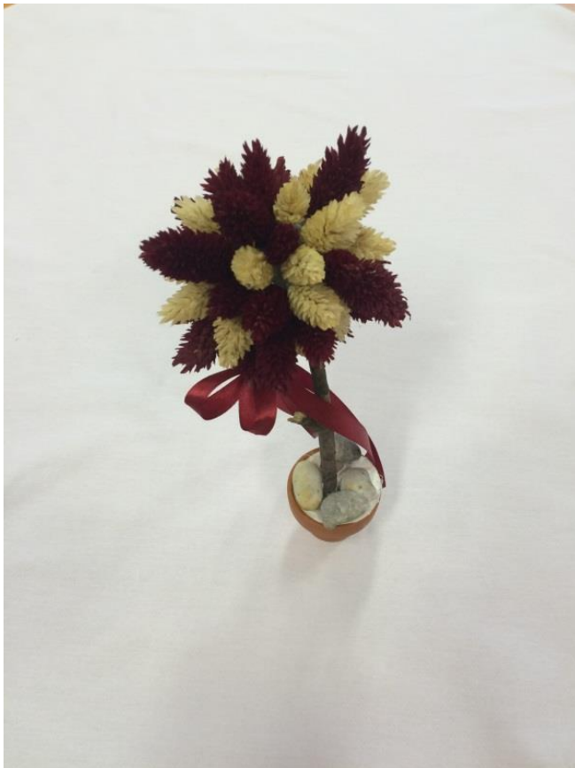
"VVV" Varázslatos Virágok Világa (szárazvirágdísz)