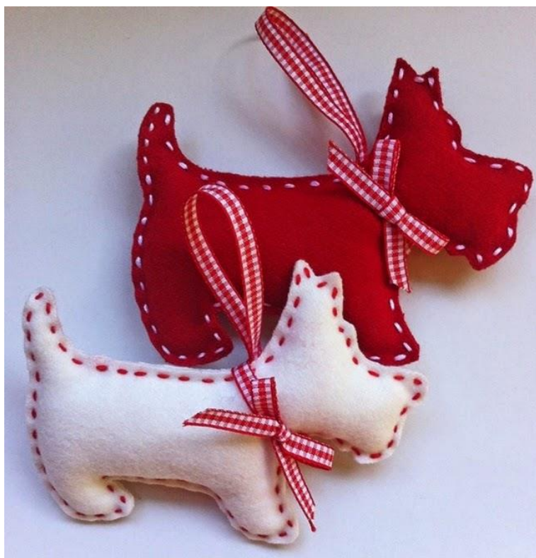
"Vágj bele és öltöges!" Kézi varrással készített, állat formájú filc túpárna vagy kulcstartó