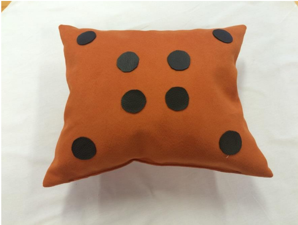
"Pöttyös-pettyes" Bútorszövetből készített, pettyes mintázatú álomhozó kispárna.