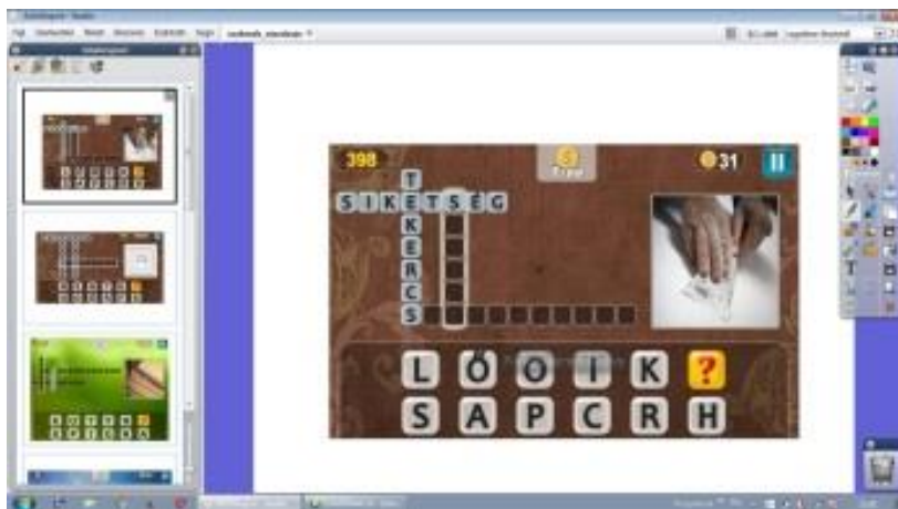
"Útikalauz az információ világába" játékos tesztkitöltés