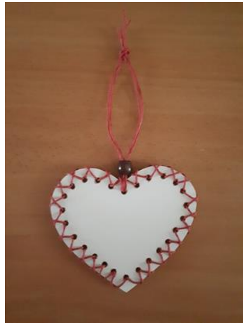
Tavaszi dísz készítése fából