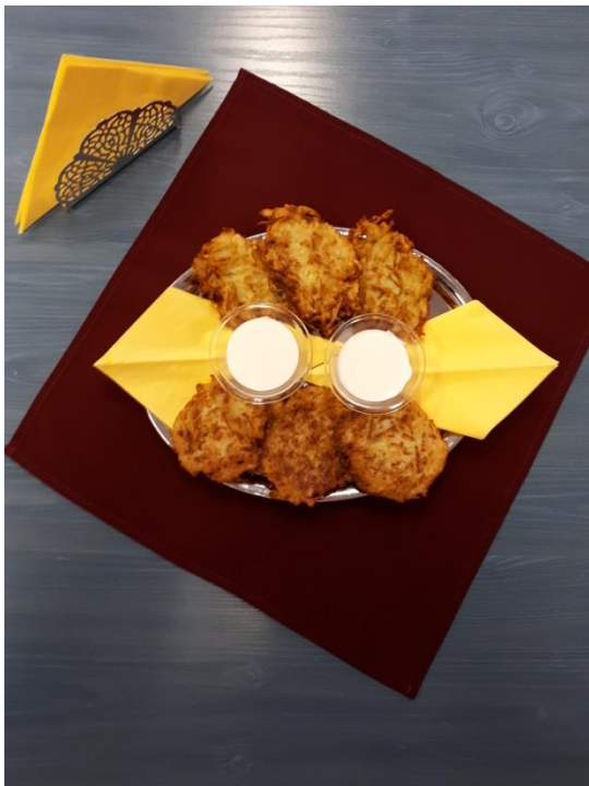
"Tocni sütés a Szabókyban! Reszeled, kevered, kisütöd, megeszed."