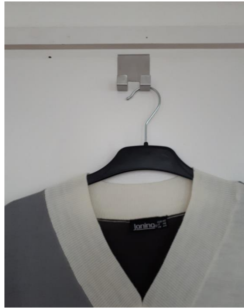
Horganyzott fémlemezből készített ruhaakasztó ajtóra.