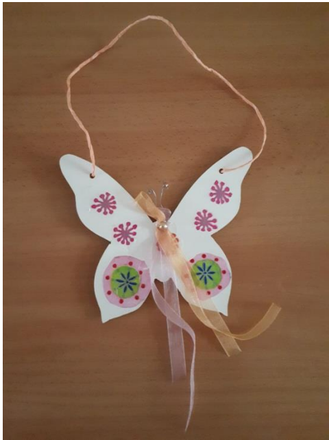
"Szakéj pillangó" Tavaszi ajtódísz készítése dekopázsolással.