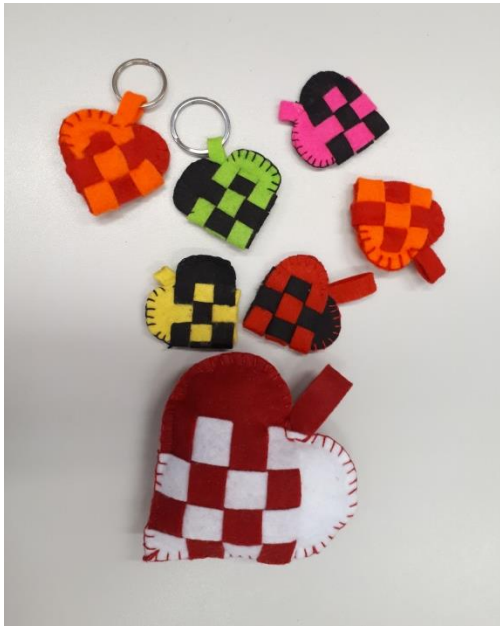
Kézi varrással készített, szív alakú kulcstartó