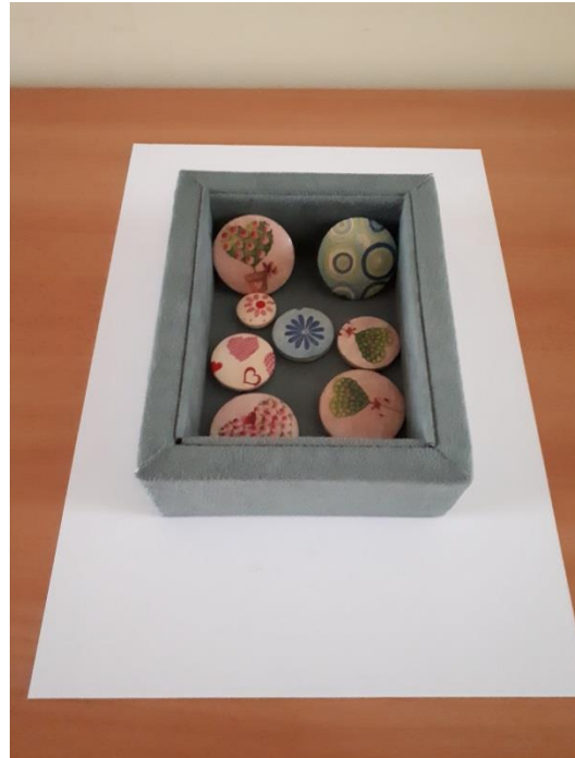
"Varázsdoboz" készítése bútorszövet felhasználásával.